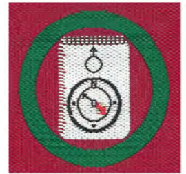
オリエンテーリング