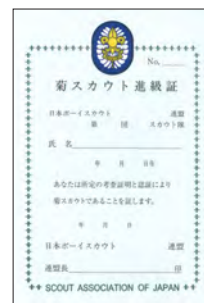
新菊スカウト進級証