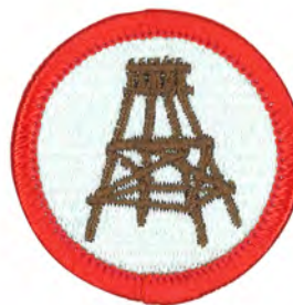
パイオニアリング