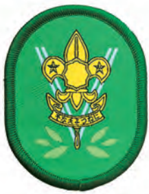
アドベンチャーバッジ