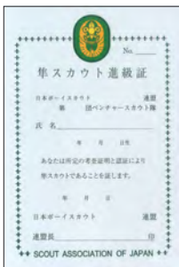
新隼スカウト進級証