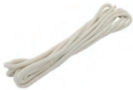
結索訓練用ロープ 6m