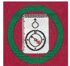
オリエンテーリング