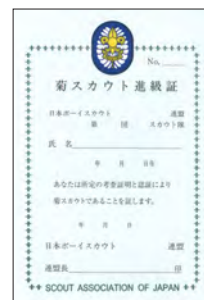
新菊スカウト進級証