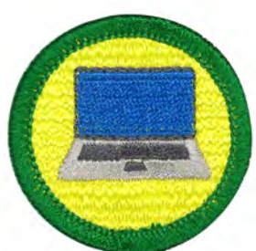
コンピューター No.55436 ¥440