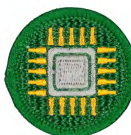
情報処理 No.55434 ¥440