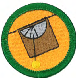
計測 No.55423 ¥176