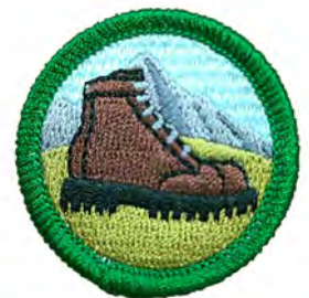
ハイキング No.54414 ¥176