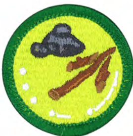
通信 No.55421 ¥176