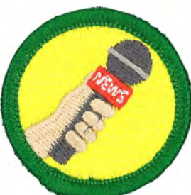
報道 No.55429 ¥440