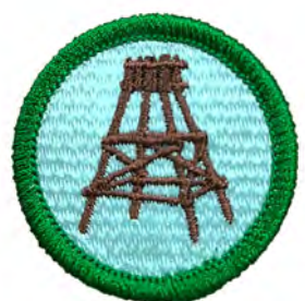
パイオニアリング No.54418 ¥440