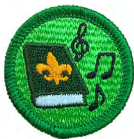
スカウトソング No.54416 ¥176