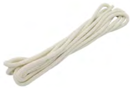
結索訓練用ロープ 6m