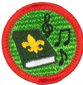
スカウトソング No.55416 ¥176