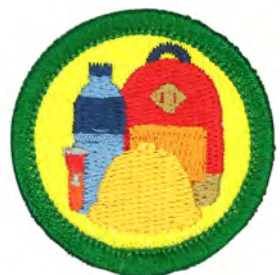
防災 No.55427 ¥440