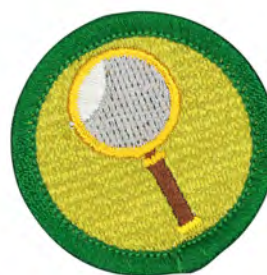
観察 No.55425 ¥176