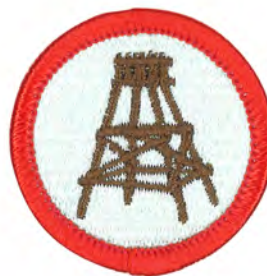
パイオニアリング No.55418 ¥176