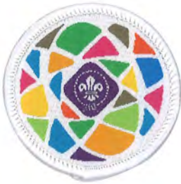
Earth Tribe バッジ