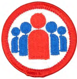
リーダーシップ No.55412 ¥176