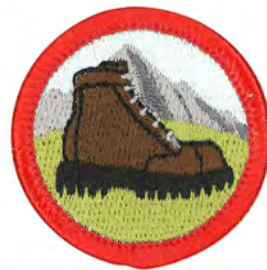
ハイキング No.55414 ¥176