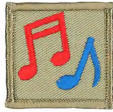
レクリエーション係