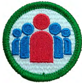
リーダーシップ No.54412 ¥176