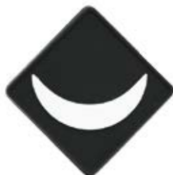
月の輪チーフリング 28005 ¥330