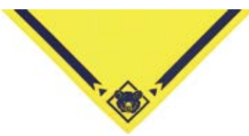
ネッカチーフカブ カブスカウト用 (短辺 65cm) 27300 ¥825