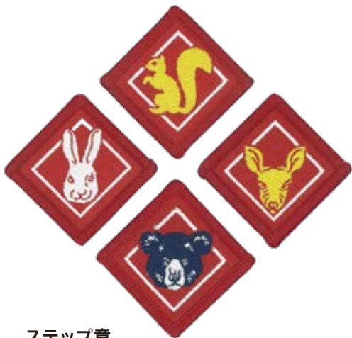
ステップ章 各 ¥187