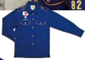
カブスカウトシャツ ¥3,300 (半袖) ¥4,070 (長袖)