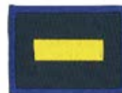
CS 次長章 58128 ¥165