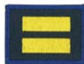
CS 組長章 58112 ¥165