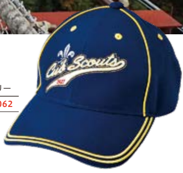
カブキャップ ¥1,430 サイズ フリー 品番 21062

※ サイズの後に、半袖なら「S」、長袖なら「L」が入る 例：CS130S 特注/半袖 11309 ¥4,950、長袖 11409 ¥6,105